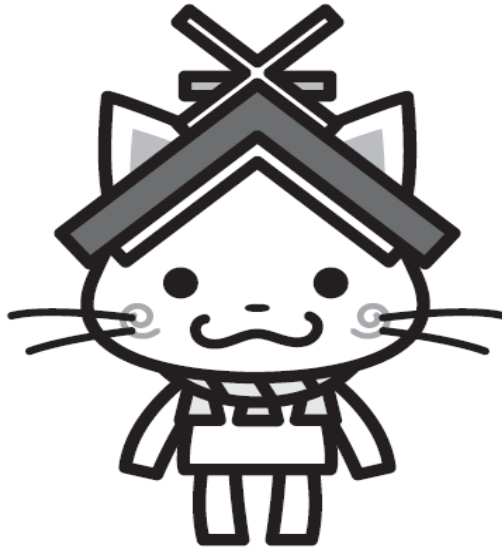
島根県観光キャラクター「しまねっこ」 島観連許諾第3731号