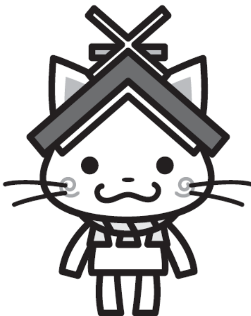
島根県観光キャラクター「しまねっこ」 島観連許諾第7571号

会 場 松江総合運動公園 日 程 2023年11月4日(土)～11月5日(日) 主 催 島 根 県 テ ニ ス 協 会 後 援 (公財) 島 根 県 ス ポ ー ツ 協 会 主 管 島 根 県 テ ニ ス 協 会 ジュニア委員会 島 根 県 テ ニ ス 協 会 審判委員会